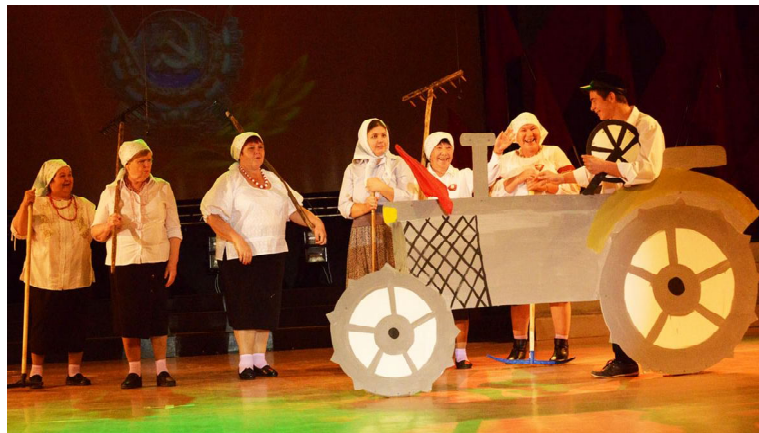
Журавлевское сельское поселение рассказывает о годах самоотверженного труда, за который комсомол награжден орденом Трудового Красного Знамени