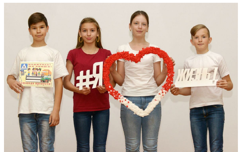
Учащиеся СОШ №1 с домашним заданием

На конкурсе фотографий «Фокус безопасности» каждая команда показала заранее отснятый фотоматериал на заданную тему. На «Светящийся флешмоб» - заранее подготовленное действие с использованием лозунгов. Их учащиеся изготовили с применением различных технологий и световозвращающей пленки. Ребята также разработывали электронные модели схем безопасного маршрута дом-школа, защищали их. Юные инспекторы движения соревновались в конкурсе сценариев авторского мероприятия по БДД для населения.