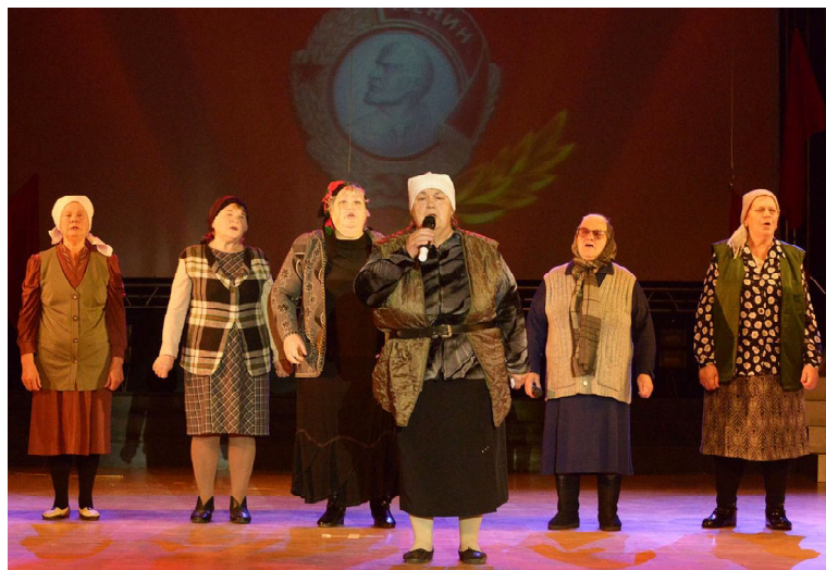
Ветеранский коллектив Большекрасноярского сельского поселения представил достижения, за которые ВЛКСМ отмечен орденом Ленина

открытие кладовых нефти, строительство БАМа, Магнитки, Турксиба, электростанций в Сибири. Всего, где в первых рядах был комсомол и не перечислить. Творческие коллективы постарались передать в своих выступлениях безграничную любовь к стране, готовность отдать жизнь за родину.