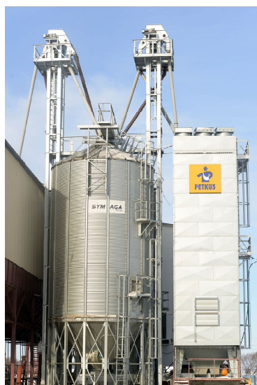
Сушильно-сортировальный комплекс с наступлением тепла возобновил работу