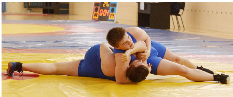
Прием «захват за голову»