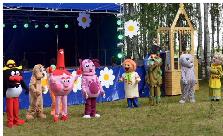
На певческой поляне

Со сцены, украшенной ромашками, звучали Гимн семьи, признания в любви, заповеди домостроя. Зрителей радовали номера самодеятельных артистов Омутинского района. Торжественным моментом стала