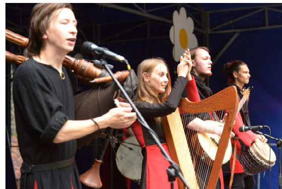
Выступает этно-фолк группа «Гилиад»