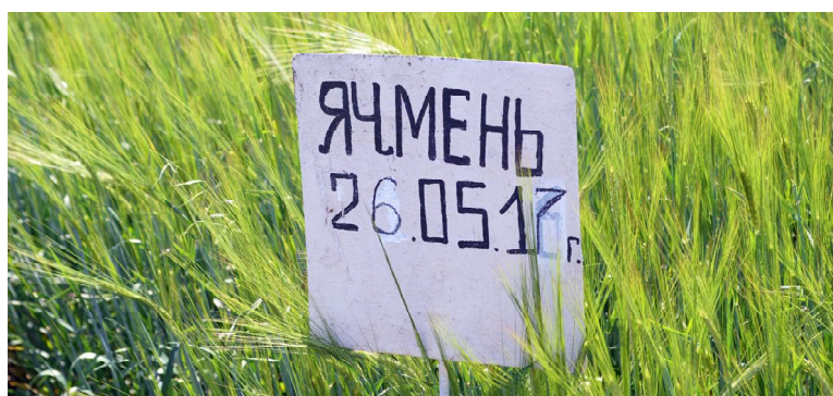
Созревает будущий урожай