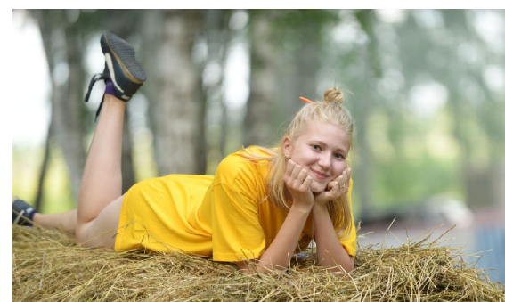
Отдохнем на природе