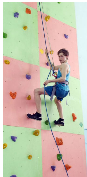
Тренировка на скалодроме