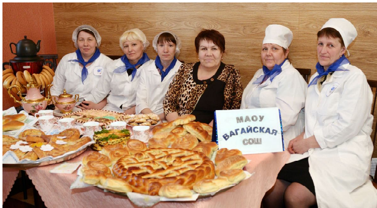
Команда Вагайской СОШ приехала за победой