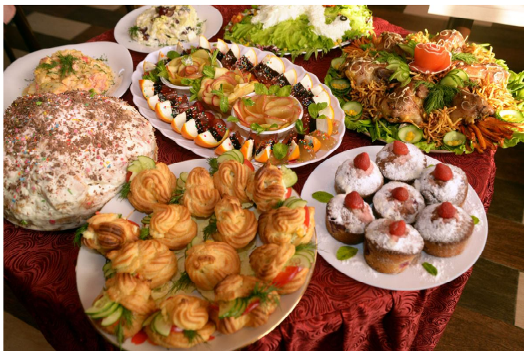
Блюда от кафе «Премьер»