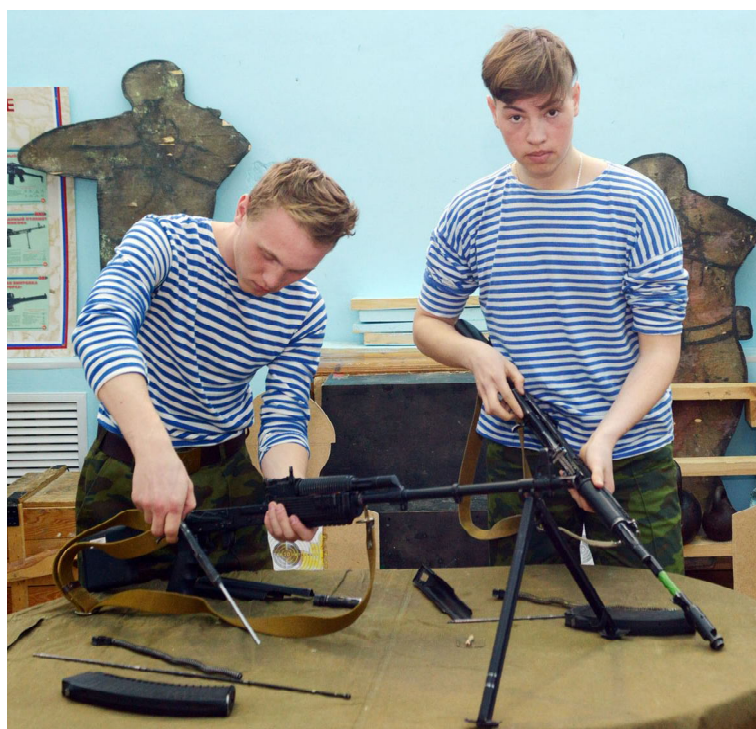
Курсанты СГ ДПВС «Подъем» обрабатывают сборку-разборку автомата