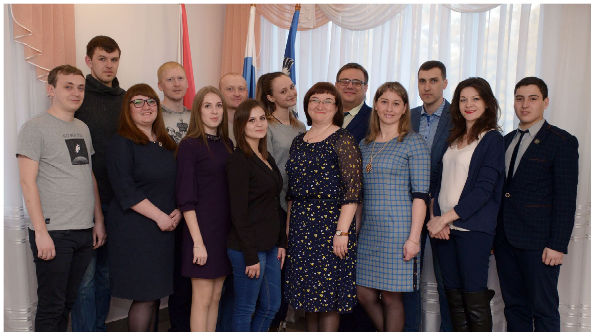
Члены Общественной молодежной палаты