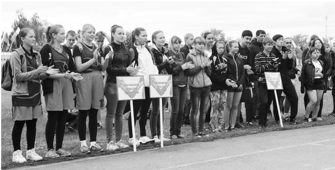
Торжественное открытие летних сельских спортивных игр