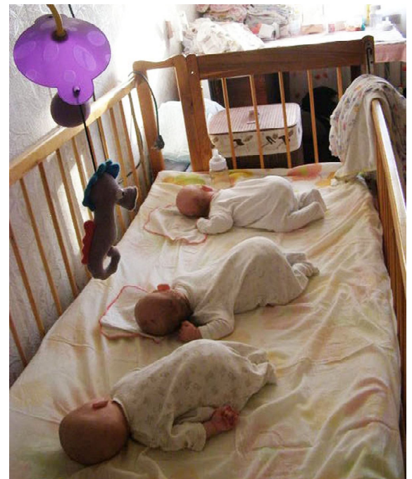
У тройняшек сон-час

ляске, оставшейся от старшей сестры, но скоро им станет тесновато.