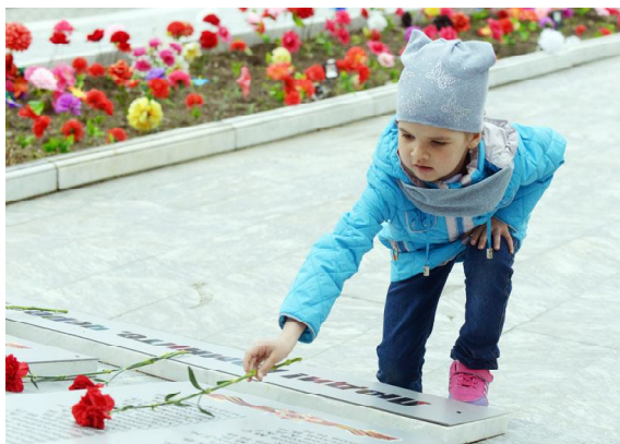
Цветы от благодарных потомков