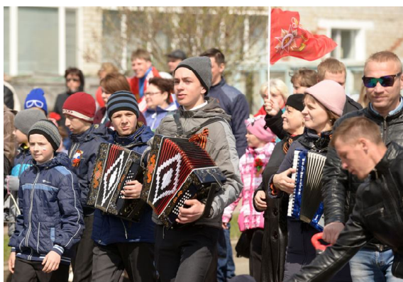
Ансамбль «Удальцы» Детской школы искусств поднимал настроение участникам парада

Несколько тысяч омутинецов 9 мая слились со всей страной в единую «реку памяти» «Бессмертного полка», чтобы отдать дань памяти тем, кто пал в боях в годы Великой Отечественной войны, чтобы еще раз чествовать тех, кто принес миру победный триумф в борьбе с фашизмом.