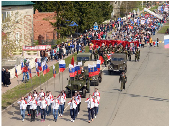
Праздничный парад идет по ул.Калинина

Страна отметила 72 года со Дня Великой Победы