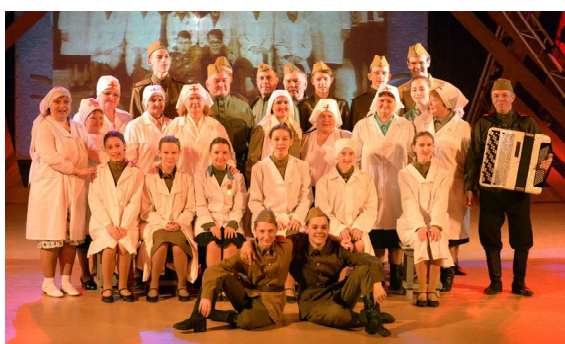
Фрагмент театрализованной постановки в РДК