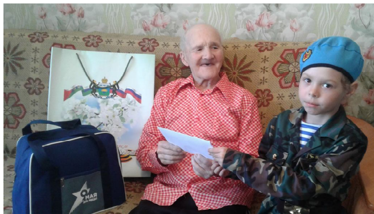
Петр Романович Пантелеев