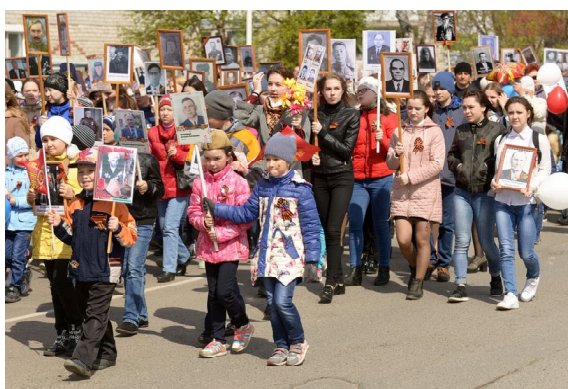
Акция «Бессмертный полк»