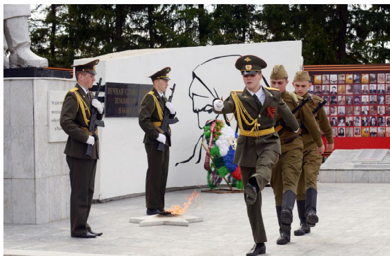
Смена почетного караула