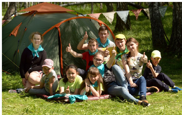
Слет - это здорово!