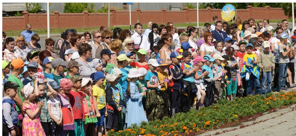
Памяти павших будем достойны!