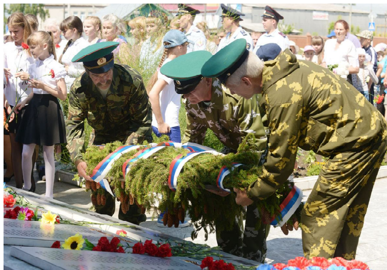
Венок к памятнику возлагают ветераны-пограничники