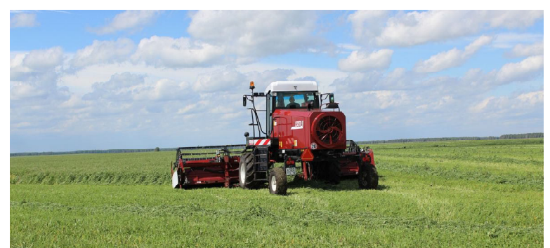
Идет косовица эспарцета