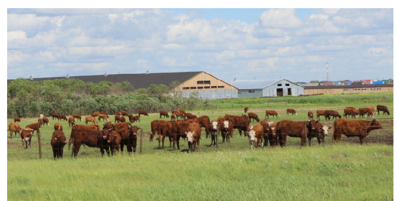
Подрастающее поколение, будущие потребители кормов