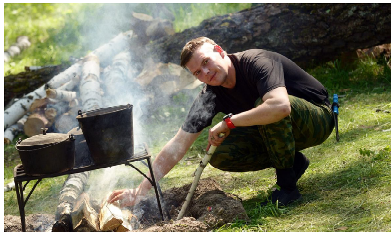
У лесного костра