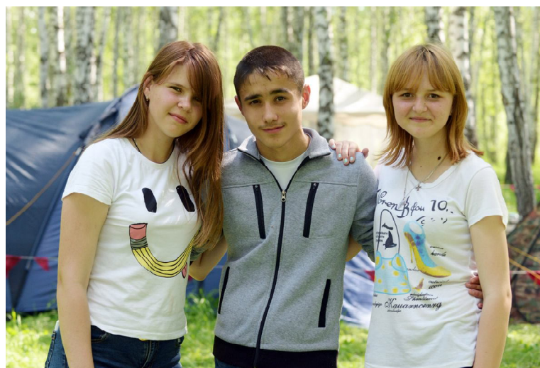
Лидеры - это дружба, общение и задор