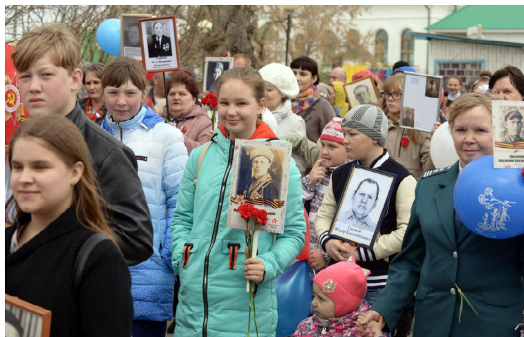
Всероссийская акция «Бессмертный полк»

Участники автопробега завершили его у памятника воинам-землякам, погибшим в годы Великой Отечественной войны, возложили цветы к его подножию и запустили в небо белые шары в память о тех, кто отстоял Отечество.