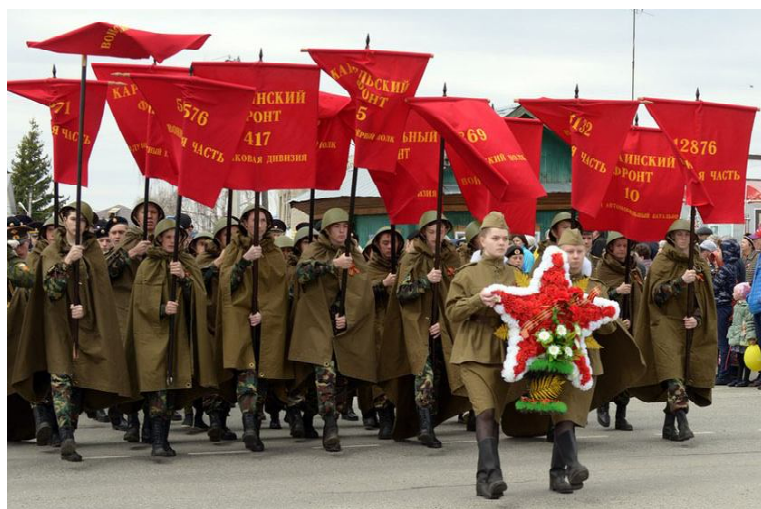
Штандарты фронтов Великой Отечественной войны несут курсанты СГ ДПВС