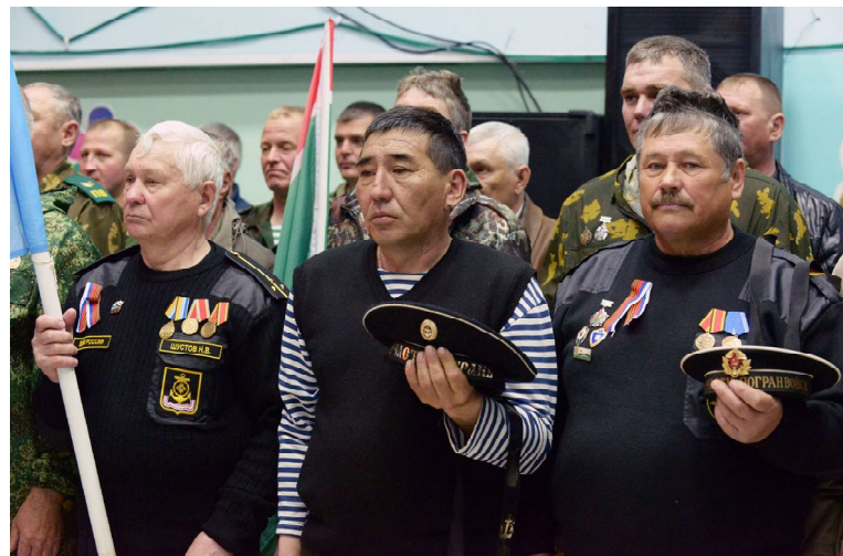
Почтили минутой молчания