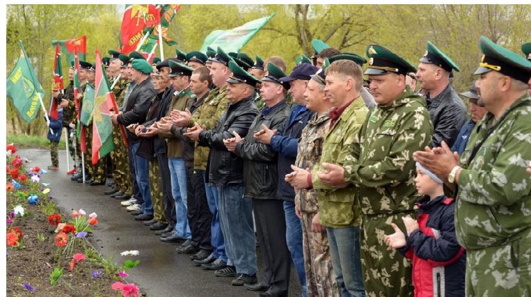
Ежегодно пограничники собираются у памятника воинам-землякам, чтобы возложить венки и отдать дань памяти тем, кто отстоял Отчизну