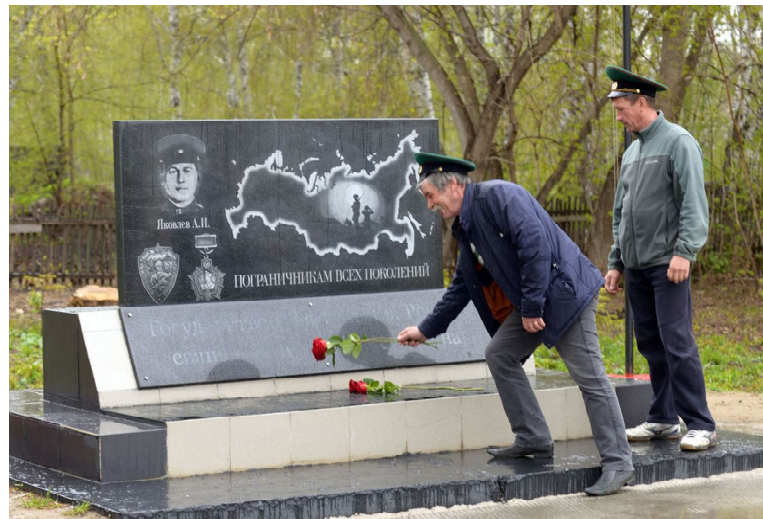
Возложение цветов к стеле воинов-пограничников (с.Вагай)