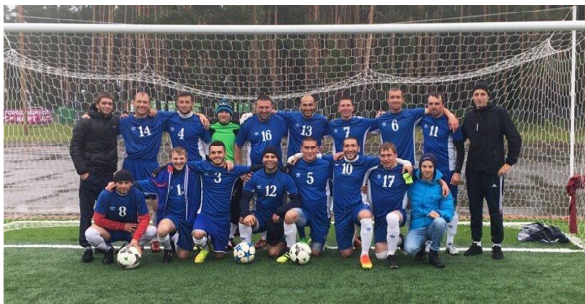
Сборная «Рубин» после победы на Кубке Губернатора Тюменской области (2017г.)

Беседовала А. ПАЙВИНА