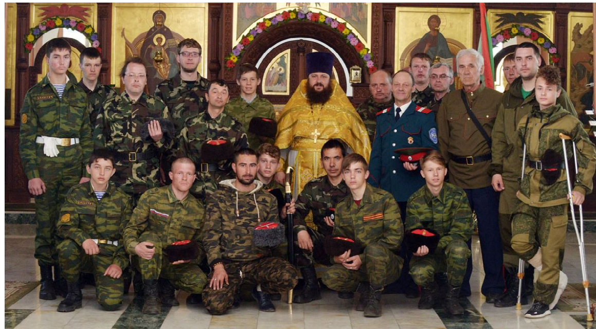
Казак после принятия присяги в Храме в честь Богоявления Господня