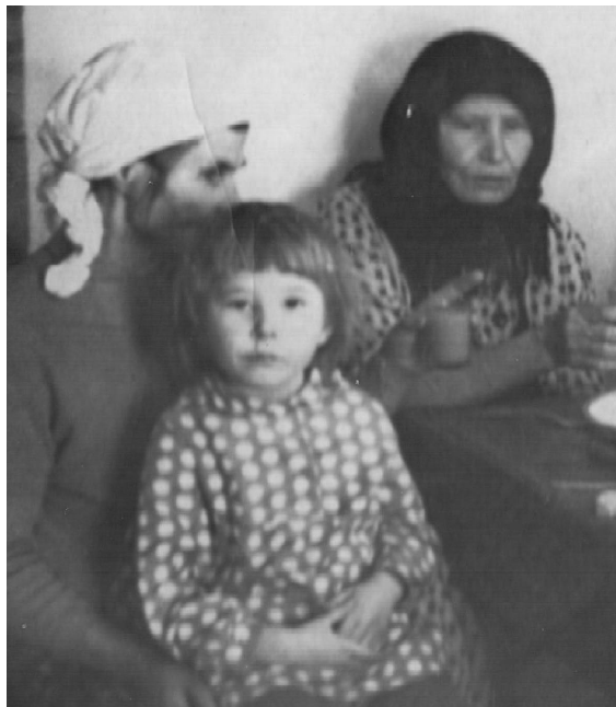
Сестры Пинигины (мама Екатерины на руках у бабушки)