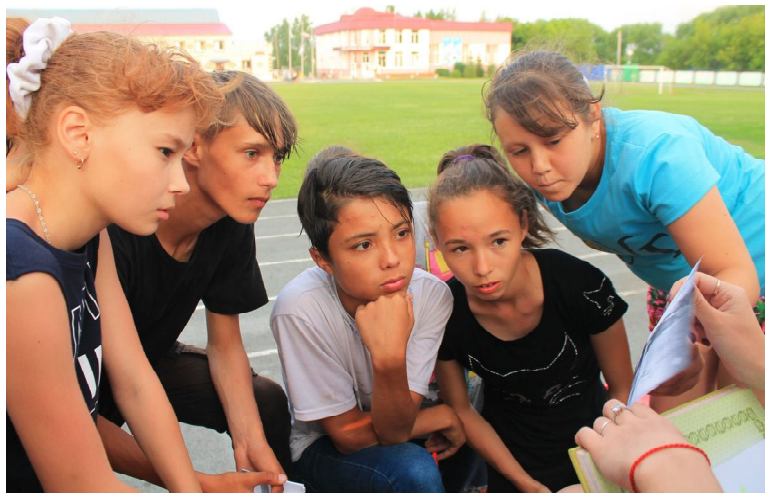
«Казачья вольница» участвует в викторине

Наверное, нет человека, который бы не верил в приметы, случайности и совпадения. У каждого есть что-то свое, проверенное на личном опыте. К примеру, считается, что не стоит вставать с левой ноги, возвращаться домой за забытой вещью, зашивая в дорогу одежду. Знакомое всем суеверие связано с одним особенным днем. Когда речь заходит о пятнице 13-го, многие испытывают страх и непонятную тревогу. Причиной тому миф, согласно которому в этот день намного повышается риск, что произойдет нечто плохое, поэтому стоит остерегаться и сохранять осторожность.