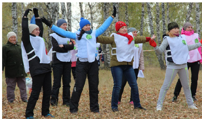
На разминку становись!