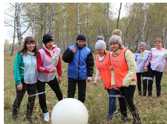
Начинается матч века «ЦРБ» на «ЦРБ»

В ходе мероприятия коллективы создавали экообъекты. Поражали нарядами на дефиле «Трэш-фантазия». Удивительно, сколько можно придумать моделей одежды из обычных полиэтиленовых пакетов, упаковок от кофе, пластиковых бутылок и другого мусора. Командам удалось превратить этот хлам в гламурные вещицы: кокетливые шляпки, фраки, бальные платья.