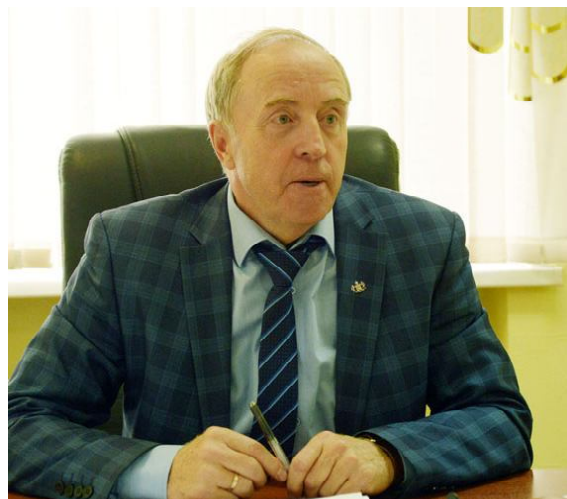
Депутат областной Думы В.А.Рейн