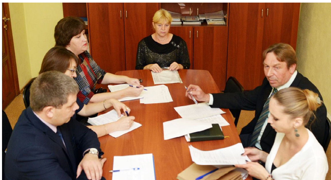
Идет прием граждан