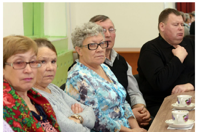
Гости Дня белой трости