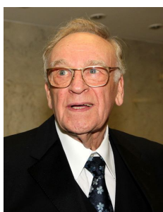
«КАРМАННЫЙ ДОКТОР» - вернул меня к жизни!