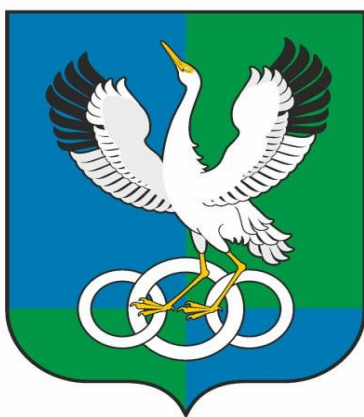
Герб сокращенный (без короны)