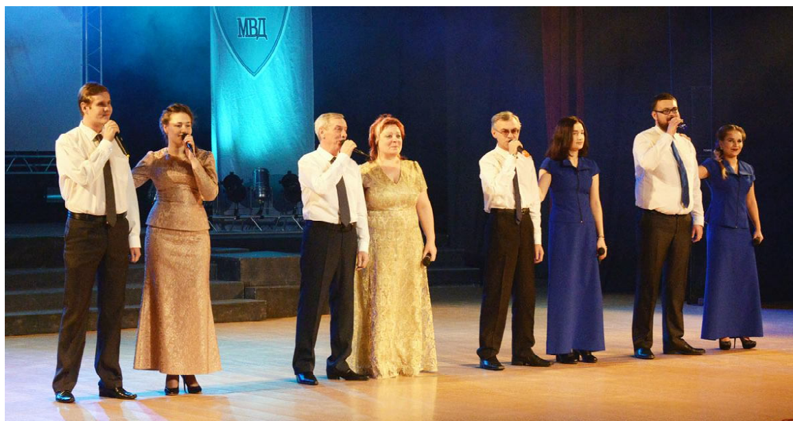
На праздничном концерте в районном Доме культуры