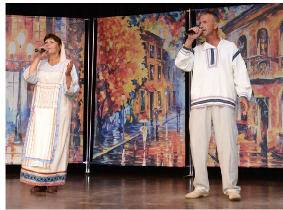
На концертной площадке