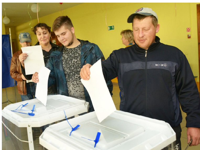
Селяне голосуют активно

трудоустройства и была стабильность - это главное.