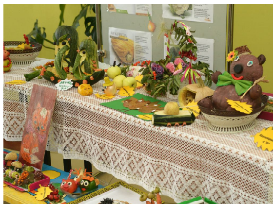
Поделки из овощей

На празднике «Золотой осени» можно было полакомиться аппетитным шашлыком, пирогами, пиццей, отведать настоящего алтайского меда. Особым