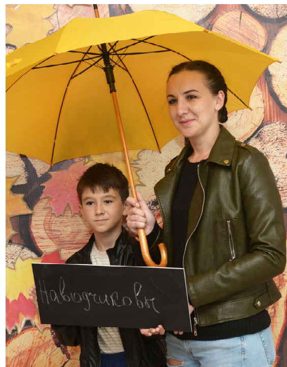
Надеемся на приз