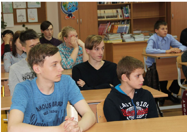
Идет урок об ответственности несовершеннолетних на тему: «Мы в ответе за свои поступки»

несовершеннолетних и защите их прав и учреждений социальной защиты населения.