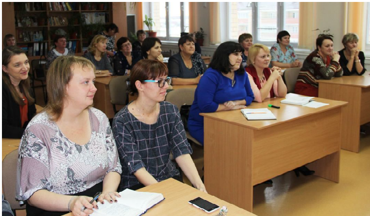
Педагоги изучают ошибки в работе с трудным ребенком

воспитания обучающихся. Для проведения уроков были привлечены сотрудники МО МВД России «Омутинский», специалисты отдела образования администрации района, районной больницы, комиссии по делам