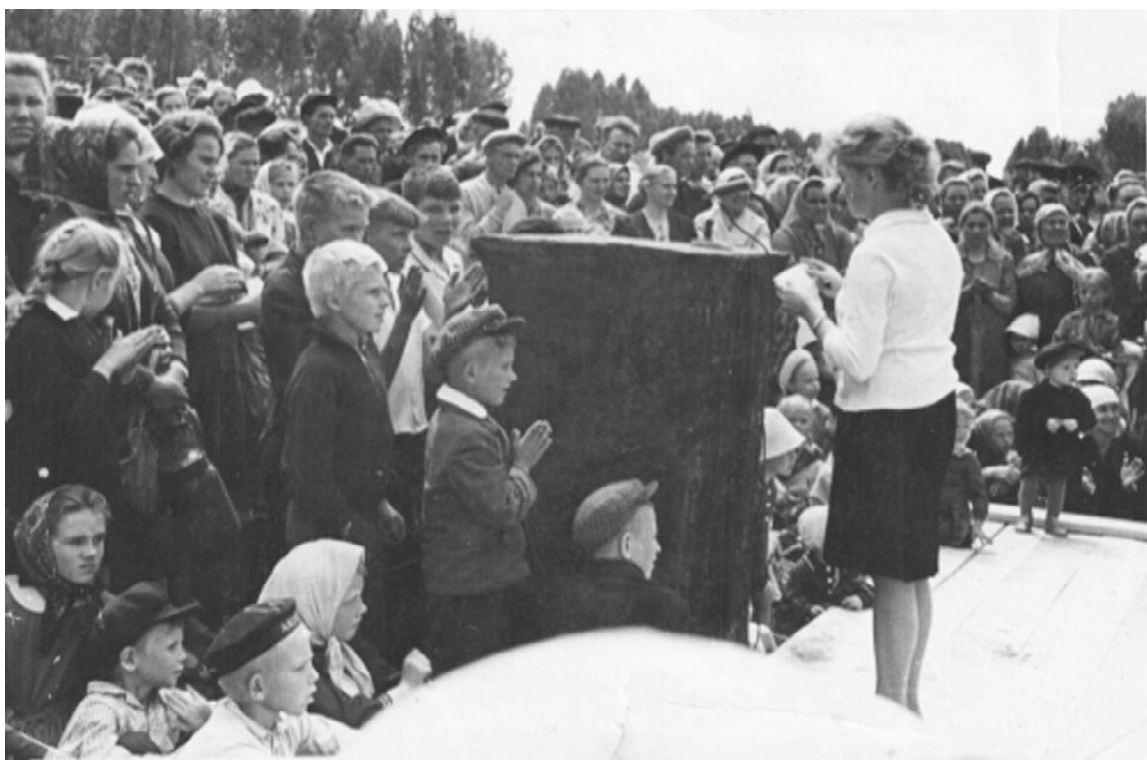
Второй секретарь РК ВЛКСМ в гуще народа

- В Управлении сельского хозяйства состоялось совещание об организации уборочных ра-