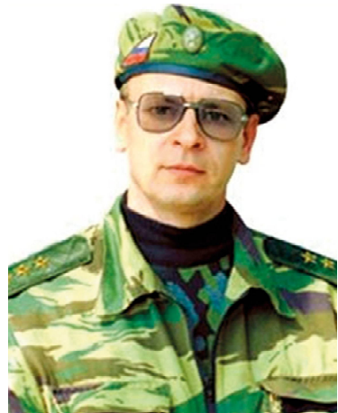
Герой России А.А. Романов

В преддверии празднования 70-летия Героя России, генерал-полковника Анатолия Александровича Романова сотрудники Росгвардии Омутинского района провели Урок мужества для учащихся Омутинского отделения Заводоуковского агропромышленного колледжа, на котором познакомили ребят с историей жизни и подвигами легендарного офицера.