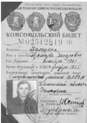
Комсомольский билет, выданный в 1955 году

ями. В каждой школе работали политкружки. Молодежь, не имеющую 8-летнего образования, мы направляли в заочную школу. Решали вопросы ликвидации второгодничества в школах, как добиться успеха в обучении детей.