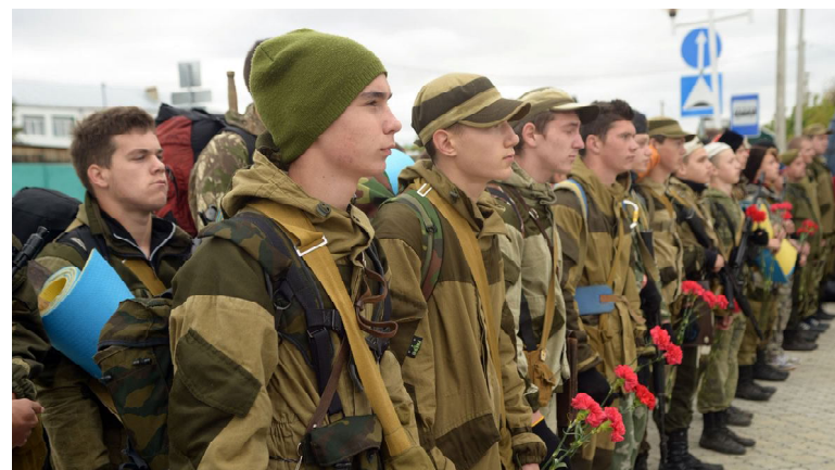
Будущие защитники России